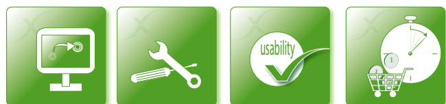
Horti-MaXimum ease of configuration

Haben Sie Bedarf an bezahlbaren Prozesscomputern einer Premiummarke, die mit den Anforderungen Ihrer Kunden mitwachsen? Dann ist der CX500 die beste Lösung für Sie. Für weitere Informationen oder eine Vorführung setzen Sie sich bitte mit uns in Verbindung.